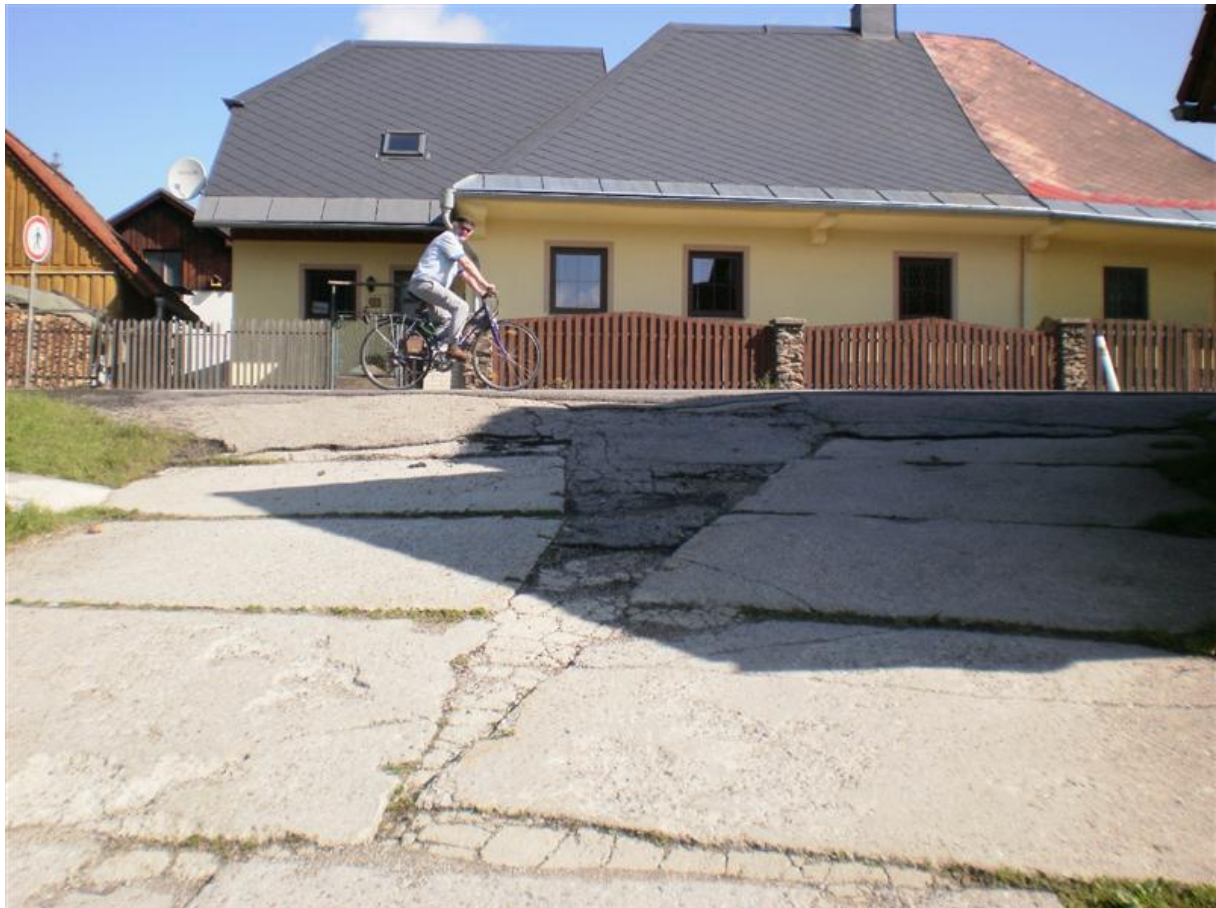
U tří bytovek ( pod pecí)