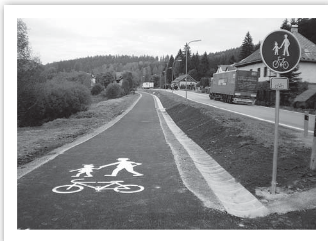
Nová cyklostezka a chodník