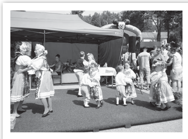
Vzpomínka na Lenorskou slavnost