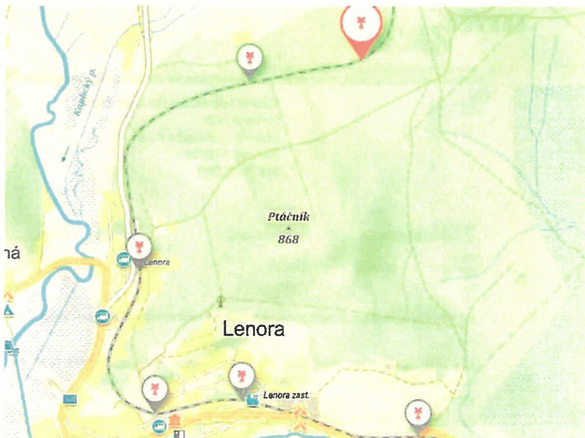
Obrázek 3 mapa P 1029