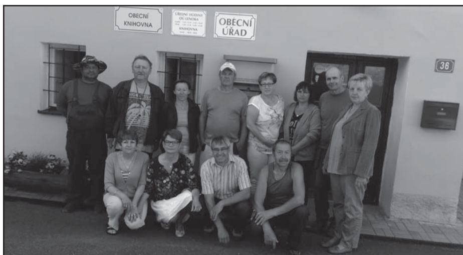
Zaměstnanci obecního úřadu