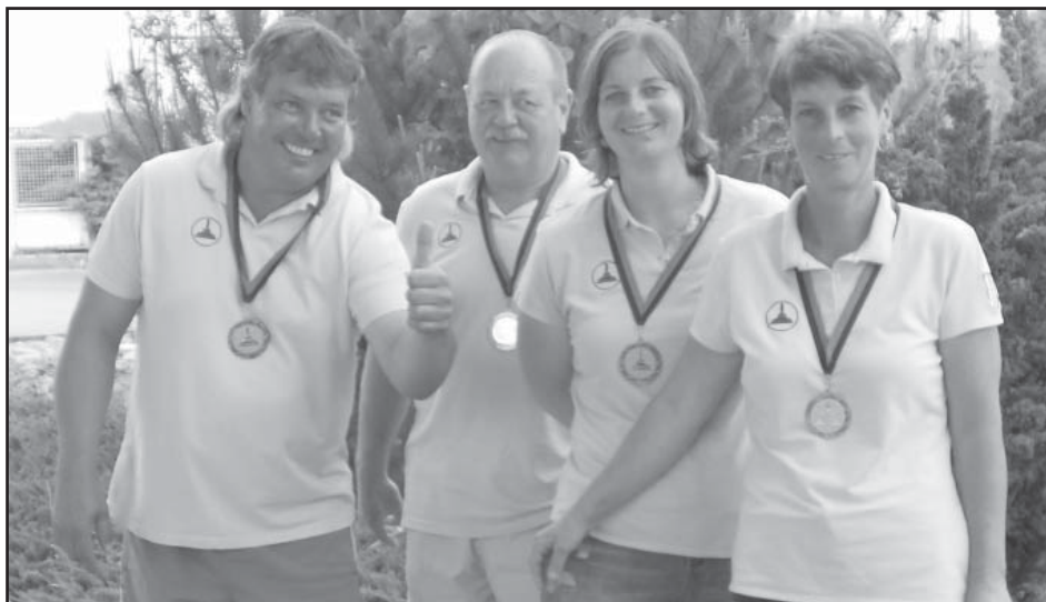
Bronzové družstvo z Mistrovství ČR MIX