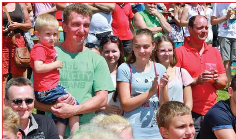
Spokojení návštěvníci slavnosti