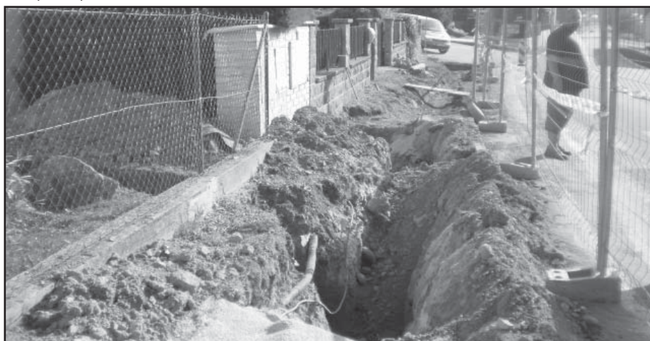
V průběhu prací