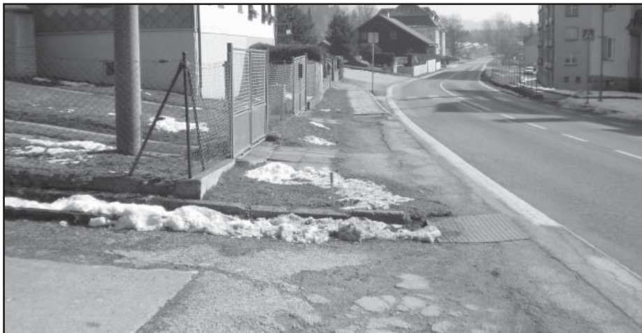
Stav před opravou

Odstavná plocha u zdravotního střediska byla naopak bleskovou akcí, kdy během jediného týdne firma STRABAG vybourala staré betony, vybuodovala odvodňovací žlaby a nové vpustě, položila podkladové vrstvy a nakonec nový asfaltový koberec.